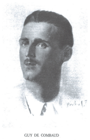
GUY DE COMBAUD

Le 4 septembre 1944, l'action héroïque du capitaine Guy de Combaud et de ses hommes parachutistes du Special Air Service a été déterminante et a durablement marqué l'histoire de cette brillante unité.